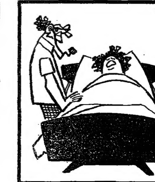
الطبيب - عندك ايه يا هاتم .. ؟ الريضة - ولد في الثانوية ويتبين في الاعراضية يا دكتور .. !

مشيتي لزوم توفي احد المومنين ، وابت زوجته وهي امرأة مسنة الا ان تشرك في تشييع الجنازة ، وبعد دفن الجنازة ، التصرف المشييمون .. وكان التعب والحزن قد حطم قوى الزوجة فجلست على مقربة من القبر ، ووقف « الحاتوني » بجانبها اطراف الحديث ، وسألتها عن سنها ، فقالت انها تجاوزت الة .. وعندئذ حز راسه قائلا : — على كده مشيتي لزوم ابدأ تتعبي تنسك وترجمي البيت .. !!